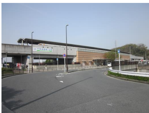
学研奈良登美ヶ丘駅