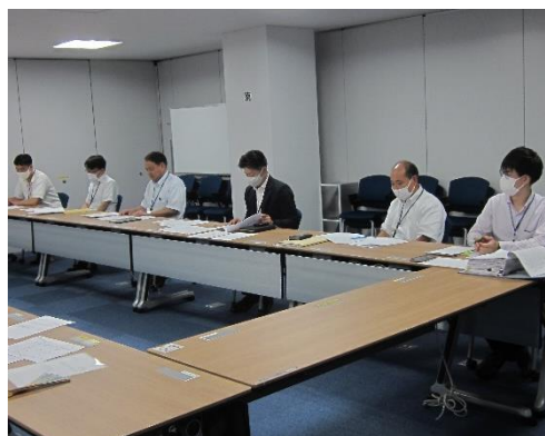
保守管理実施状況報告会(令和5年8月)