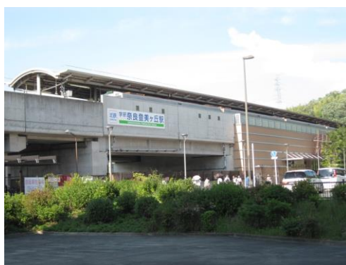
学研奈良登美ヶ丘駅