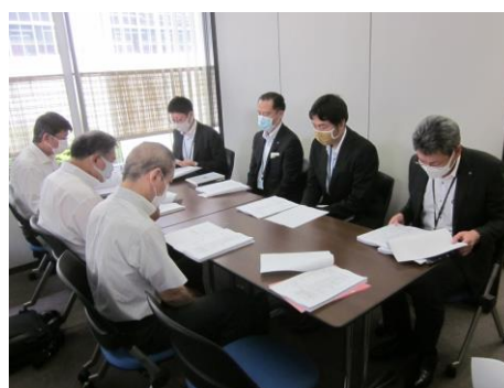
保守管理実施状況報告会(令和2年7月)