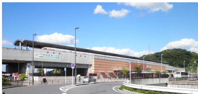
学研奈良登美ヶ丘駅