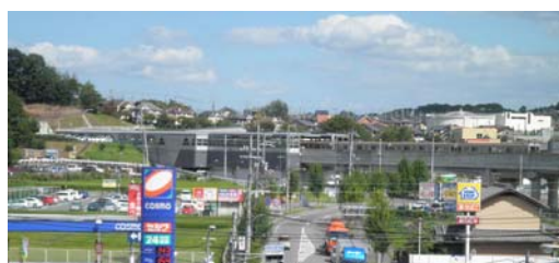
学研北生駒駅付近